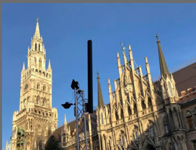
Beschallung für Notfalldurchsagen und Musikübertragung auf dem Münchner Christkindlmarkt